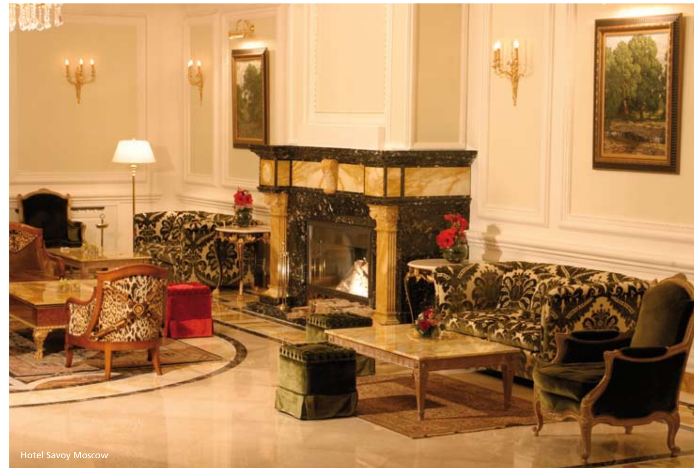
Hotel Savoy Moscow

In het hart van Ruslands 'noordelijke hoofdstad' ligt het Grand Hotel Emerald, op loopafstand van de beroemde winkelboulevard Nevsky Prospect, de Smolny Kathedraal en het Tavrichesky Paleis. In alle 76 kamers zijn draadloos internet en alle moderne faciliteiten aanwezig, inclusief zachte badjas met bijpassende slippers. De dertien suites hebben allemaal een jacuzzi en sommige suites hebben zelfs een sauna. De parel in de kroon van Emerald is de Royal Suite. De salon heeft een kristallen dakkoepel en is stijlvol gestoffeerd en gemeubileerd in klassieke Empire-stijl. Dezelfde stijl vindt u terug in de verschillende restaurants die het hotel onder zijn dak heeft, evenals in het atriumcafé Versailles en in de Suvorovsky Lobby Bar. In deze bar brandt trouwens constant een gezellig haardvuur en vindt u kranten uit alle windstreken. Daarbij klinkt elke dag live pianomuziek. Sint Petersburg, www.grandhotelemerald.com